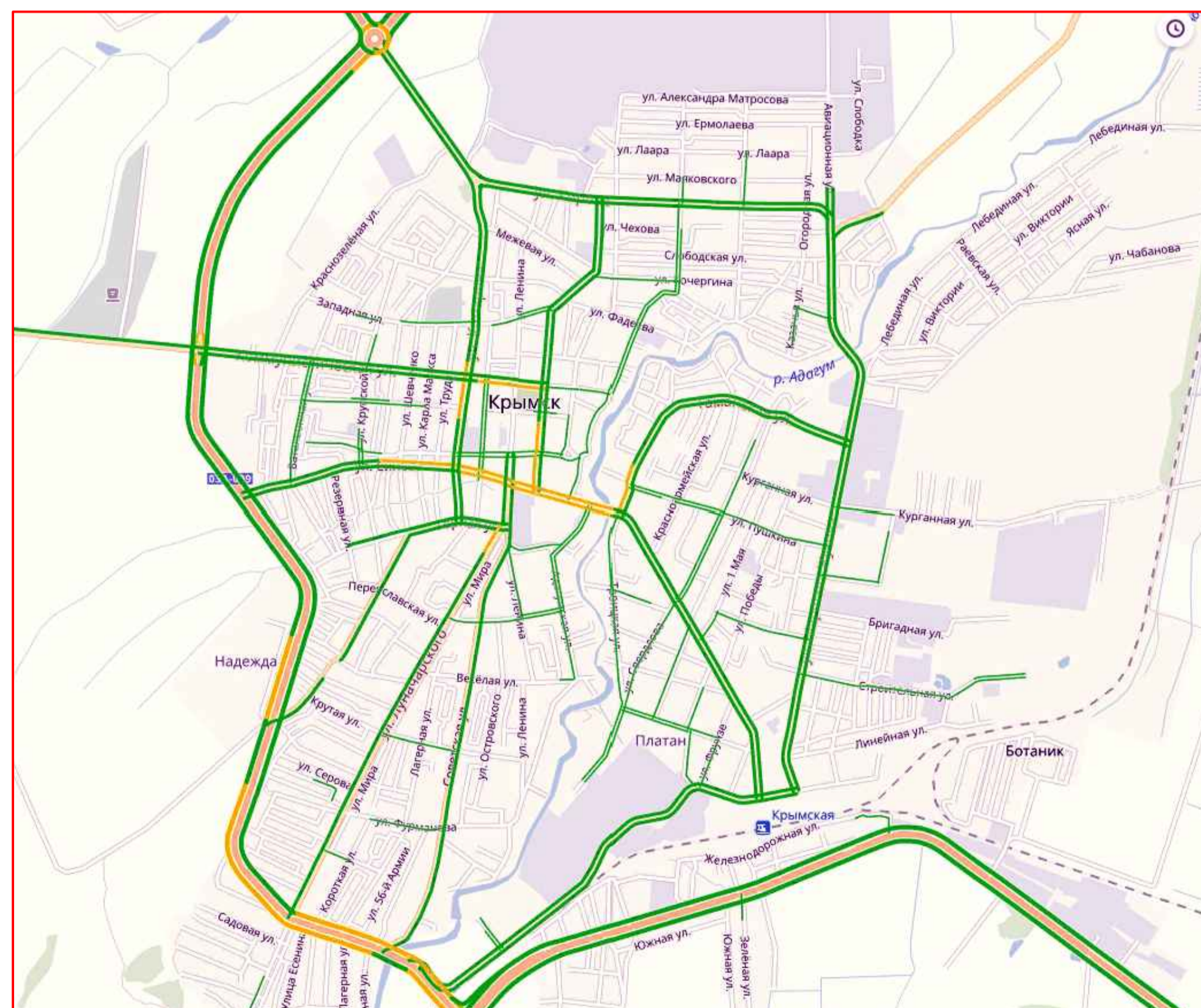
Картограмма интенсивности движения в не пиковый период на территории г. Крымск